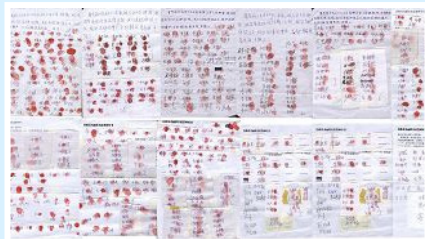
已有 897 位乡亲签名、按手印，呼吁立即释放好人葛秀丽。