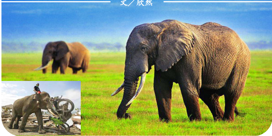
小图：南亚大海啸重灾区，一头大象用鼻子卷起摩托车，帮助清理废墟。

2002年6月，贵州省平塘县掌布乡“藏字石”现世。巨石断面显现出六个大字“中国共产党亡”，媒体报道，经多批中国最权威的地质、古生物专家考证，石龄已有2.7亿年，字乃海绵、海百合茎、腕足类等古生物化石“浑然天成”。