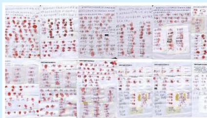
已有 897 位乡亲签名、按手印，呼吁立即释放好人葛秀丽。