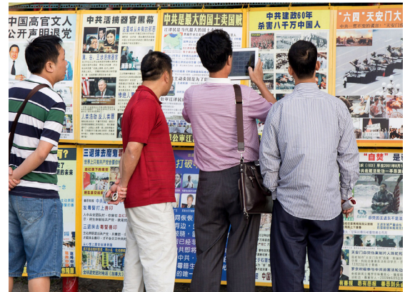
左图：台湾交通部观光局行文观光导游协会及台湾法轮大法学会，呼吁旅行行业及导游人员勿干预法轮功讲真相。上图：台湾景点陆客观看真相展板。