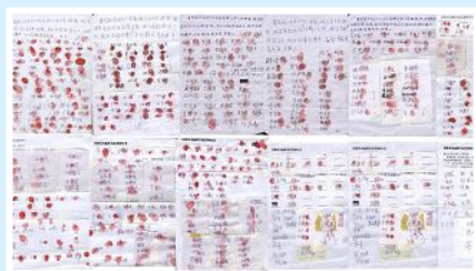
已有 897 位乡亲签名、按手印，呼吁立即释放好人葛秀丽。