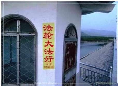
沂蒙山区的真相标语

但中共当局在蒙山区域的恶行远不止于此,也远不止一次,自 1999 年至今,盘踞在蒙山区域的中共人员为了讨好江泽民政治流氓集团,动用了大量的人力、物力、财力、警力,运用监视跟踪、暴力截访、抄家绑架、酷刑洗脑、勒索巨款、劳教判刑、阴谋虐杀的恶行手法,施用几十种酷刑:毒打、电刑、捆绑、用摩托车拖拽、长时间镣铐、烈日下罚站、装在麻袋里乱棍打、用车拖拉,臭袜子、卫生巾塞嘴、铐死人床、野蛮鼻饲、用开水烫、冷冻、烟头烧、冷水浇头灌耳朵、头上扣上大粪桶、用铁锹拍、坐雪窝吹风扇、大弯腰、侮辱妇女、长时间不让睡觉、非法跟踪监控、私闯民宅、打家劫舍、投精神病院,药物毒害毒杀、对女性耍流氓等等,以