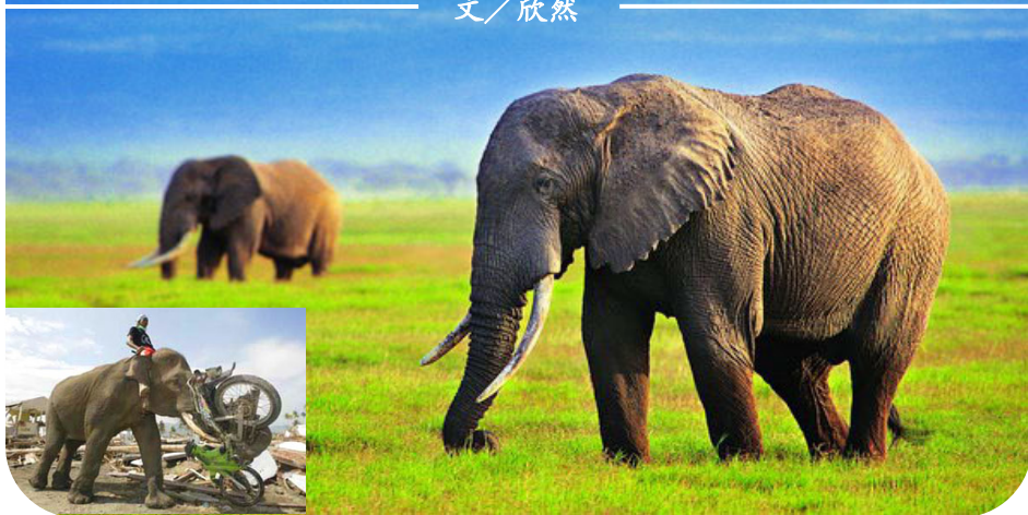
小图：南亚大海啸重灾区，一头大象用鼻子卷起摩托车，帮助清理废墟。

2002 年 6 月，贵州省平塘县掌布乡“藏字石”现世。巨石断面显现出六个大字“中国共产党亡”，媒体报道，经多批中国最权威的地质、古生物专家考证，石龄已有 2.7 亿年，字乃海绵、海百合茎、腕足类等古生物化石“浑然天成”。