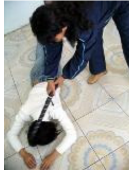
酷刑演示：电棍电击