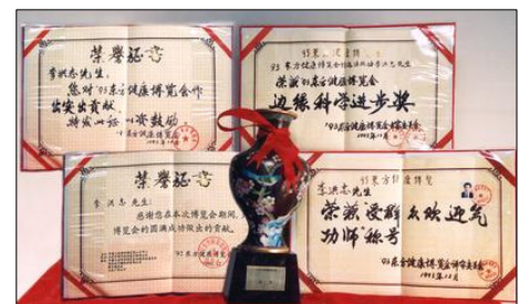
图:一九九三年十二月,李洪志先生被特邀参加北京东方健康博览会,获最高奖“边缘科学进步奖”和大会“特别金奖”及“受群众欢迎气功师”称号,是获奖最多的气功师。

支持议案信函等共三千多项。法轮功的主要著作《转法轮》已被翻译成三十多种语言,并可在网络免费下载。