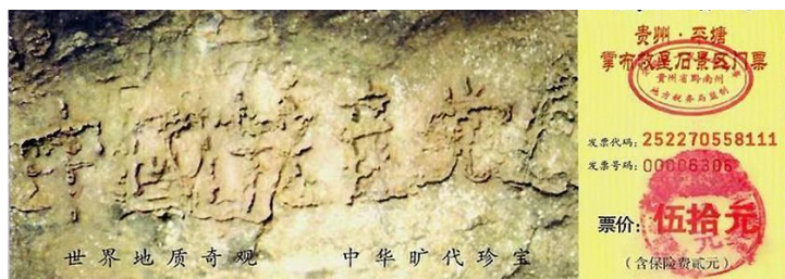
贵州省平塘县掌布乡“藏字石”风景区门票图案

大海啸过后，野生动物专家对路透社记者说：“我们没有找到一具动物尸体……动物也许能感知到这场灾难，它们有第六感。它们了解要发生的事情。”