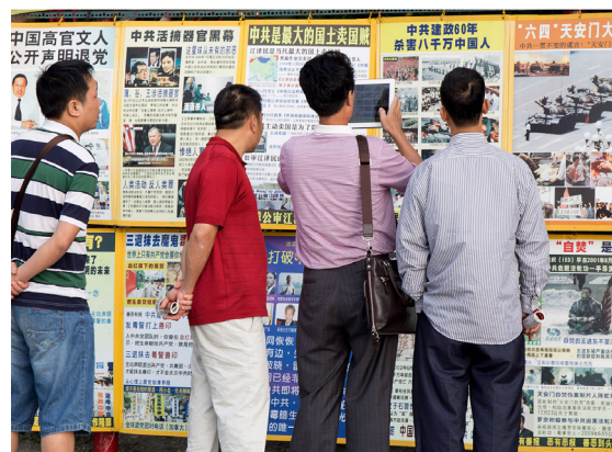
左图：台湾交通部观光局行文观光导游协会及台湾法轮大法学会，呼吁旅行行业及导游人员勿干预法轮功讲真相。上图：台湾景点陆客观看真相展板。