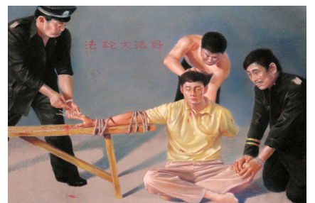
长长的竹签被从指甲下钉入指