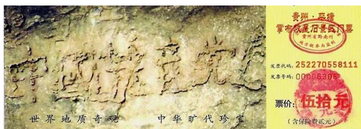
贵州省平塘县掌布乡“藏字石”风景区门票图案

大海啸过后，野生动物专家对路透社记者说：“我们没有找到一具动物尸体……动物也许能感知到这场灾难，它们有第六感。它们了解要发生的事情。”