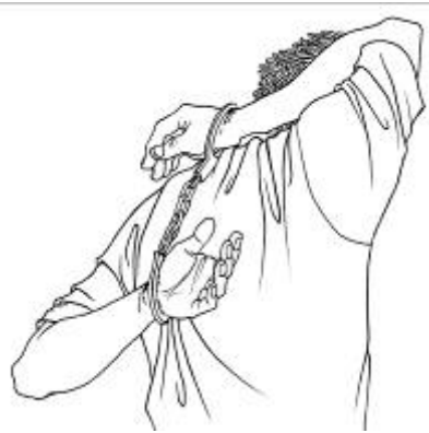
中共酷刑示意图: 背铐(“苏秦背剑”)

下午,律师再次去狱政科要求会见,狱政科科长仍然拒绝会见,律师分头去二楼找驻检,驻检办公室没人,律师去监狱纪检委控告,监狱纪检委曲姓书记答应给调查调查再回复。监狱狱政科科长露出“真面目”和律师大吵起来,狱政科的人甚至要对律师动手、要打律师的架势,在场的一女警把要动手的人一边劝说并拉到一边,律师毫不畏惧地说:你们不让见就是违法。