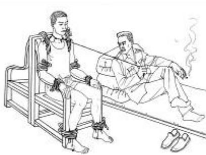
中共酷刑示意图: 刑椅

家属只好聘请律师。一月三日上午,律师们九点到呼兰监狱直接去狱政科要求会见当事人,狱政科科长一看是法轮功的案子就想把律师支到教改科(610),律师不承认610所以不去教改科,狱政科长没办法只好对律师说:我要往上汇报。律师说:610头子李东生都抓起来了你们还向谁汇报啊?科长说向省610汇报,律师说:你们还看不清方向啊?你就按法律办事。律师还说:从各个方面讲我们有权会见当事人。狱政科长理亏,就收了律师的所有手续。