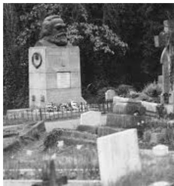
马克思死后葬身伦敦高门墓地（撒旦教活动中心），其撒旦教徒身份再被关注。

在西方文化中，撒旦通常被称作“魔鬼撒旦”、“恶魔”。显然，马克思承认有上帝的存在，还承认有魔鬼和地狱。马克思仇恨上帝，是因为被魔鬼撒旦选中，要向上帝复仇。