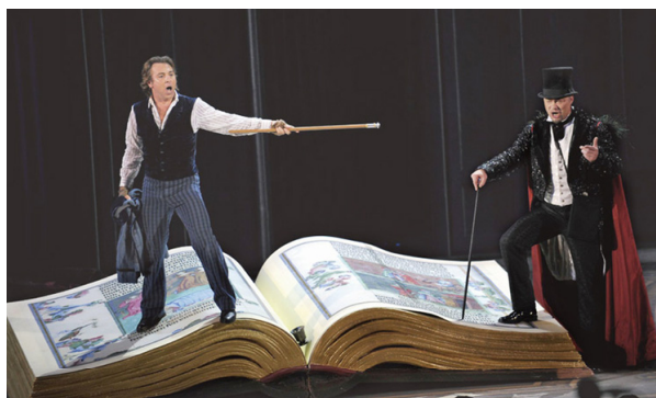
话剧《浮士德》中的恶魔梅斐斯特（右）。自称“与魔鬼撒旦签了约”的马克思，喜欢复述恶魔梅斐斯特的话：“一切存在都应该被毁灭。”