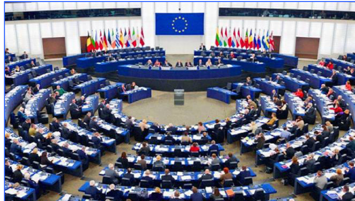
图：欧洲议会紧急议案 制止中共活摘器官

还……据她了解，其中四分之三的人已被摘取心脏、肾脏、眼角膜、皮肤后被焚尸。她的前夫在该院工作期间曾主刀活体摘取两千余名法轮功学员的眼角膜。