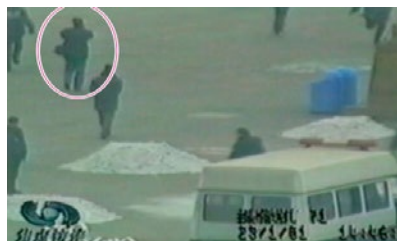
① 图中的男子，在军警间从容拍摄。

① “自焚”的画面远、中、近景俱全，最近的拍摄距离“自焚”现场不到二十米，这是多部摄影机多角度同时拍摄，若非事先安排，岂能如此完备？