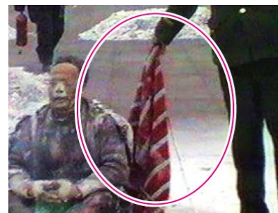
③ 天安门巡逻的警察每天都背着灭火器、带着灭火毯？

③ “天安门自焚”本应是突发事件，在短短一两分钟的时间里，巡逻的警察竟拿出十几个灭火器，还有灭火毯，人们不禁要问：难道天安门巡逻的警察每天都背着灭火器、带着灭火毯？