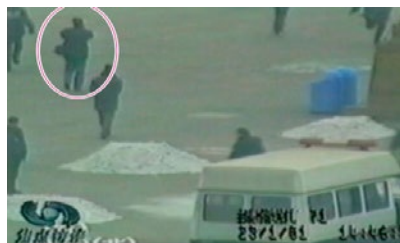
①图中的男子，在军警间从容拍摄。

① “自焚”的画面远、中、近景俱全，最近的拍摄距离“自焚”现场不到二十米，这是多部摄影机多角度同时拍摄，若非事先安排，岂能如此完备？