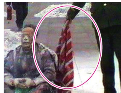
③天安门巡逻的警察每天都背着灭火器、带着灭火毯？

③ “天安门自焚”本应是突发事件，在短短一两分钟的时间里，巡逻的警察竟拿出十几个灭火器，还有灭火毯，人们不禁要问：难道天安门巡逻的警察每天都背着灭火器、带着灭火毯？