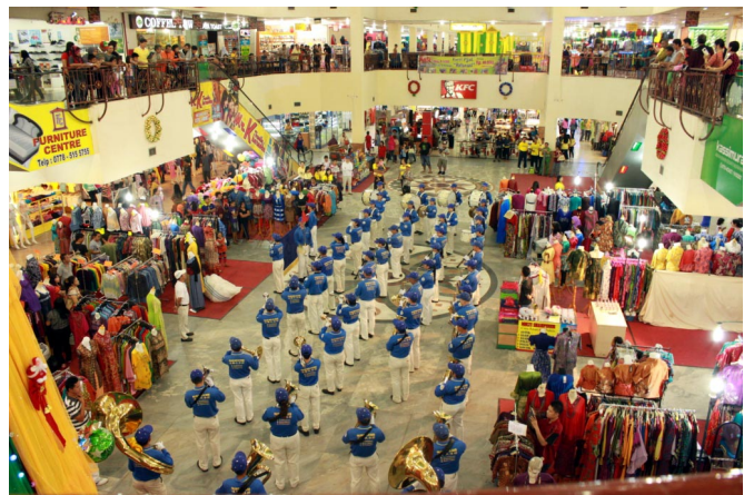
天国乐团在其中一家百货商场内演奏，音乐响遍整个商场

【明慧网】二零一三年十二月十四日与十五日，在这步近圣诞与新年佳节期间，印尼巴淡岛（Batam Island）的法轮功学员在巴淡岛举办一系列的洪法活动，由法轮功学员组成的天国乐团连续在多个地点展开演奏，把整个巴淡岛的气氛带入欢乐佳节气氛中，让当地民众为之雀跃，也感谢学员把法轮功真相告诉他们。