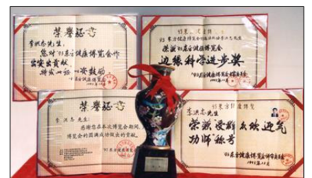
图: 一九九三年十二月, 李洪志先生被特邀参加北京东方健康博览会, 获最高奖“边缘科学进步奖”和大会“特别金奖”及“受群众欢迎气功师”称号, 是获奖最多的气功师。

支持议案信函等共三千多项。法轮功的主要著作《转法轮》已被翻译成三十多种语言, 并可在网络免费下载。