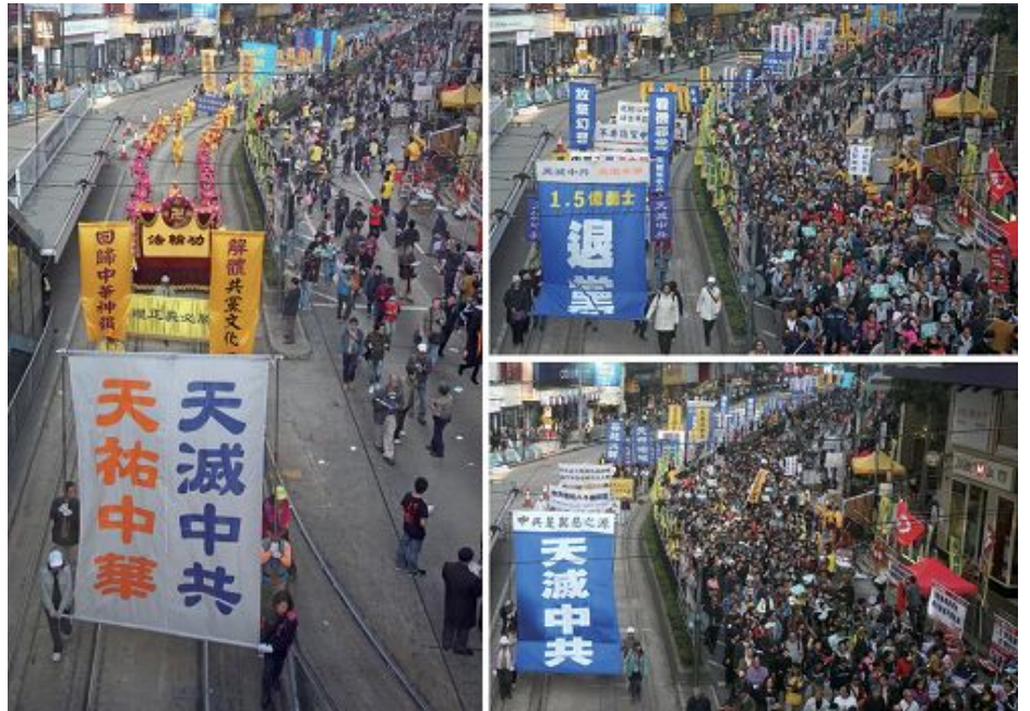
图：法轮功学员的游行队伍，真相旗阵声援退党保平安。

下午三时，由香港民间人权阵线与真普选联盟发起的新年大游行开始起步，三万港民及法轮功学员的游行队伍，陆续从维多利亚公园出发，途经铜锣湾高士威道、轩尼诗道等主要市街，游行至中环遮打道行人专区终点。由于与人民团体