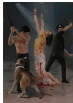
法轮功学员被中共警察毒打（绘画）

高检法医讲，不用验了，她的大腿肉被撕裂了，阴部周围还有电棍电烤糊伤，背部还有踢蹬的鞋印血迹，这明明是酷刑打死的，哪是心脏病发！◇