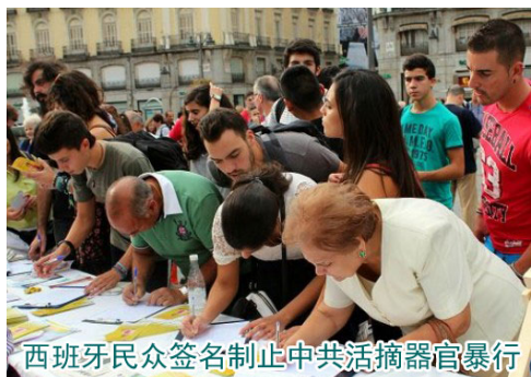
西班牙民众签名制止中共活摘器官暴行