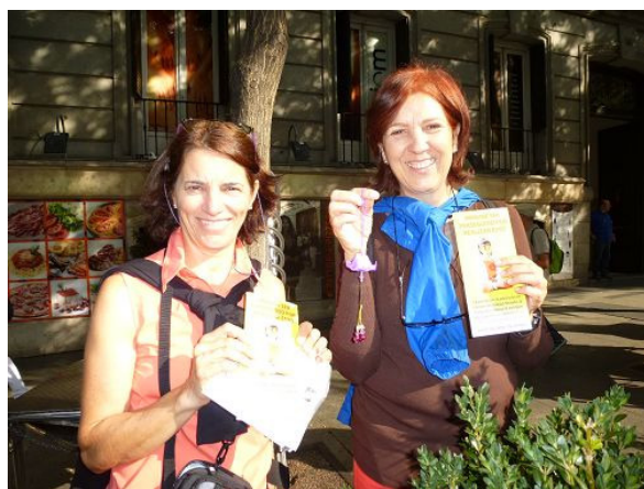
马德里居民 Maviacake 和 Clava 支持法轮功学员反迫害