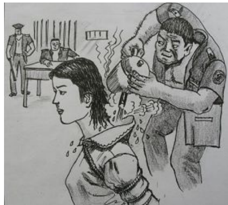
酷刑演示图：热水烫

明慧网《大连恶警对我的酷刑折磨》作者自述: 2004 年 2 月 10 日, 恶警将我带去搞强制“转化”, 这期间不给水喝, 给一点点饭, 小便一天只准一次, 大便一个星期一次, 不准睡觉, 一睡觉就给打醒。由于极度困乏, 有时睡着了打都打不醒, 打不醒就用火烧, 用点燃的塑料绳熔化的燃着火的液滴连烧带烫, 手上、臂上被烧烫出许多水泡, 伤好后留下许多疤痕。在海城看守所, 恶人把牙刷点燃, 用滴下的液体烫法轮功学员。