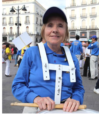
70 岁的鼓手 Strecker 女士