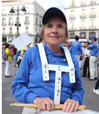
70 岁的鼓手 Strecker 女士