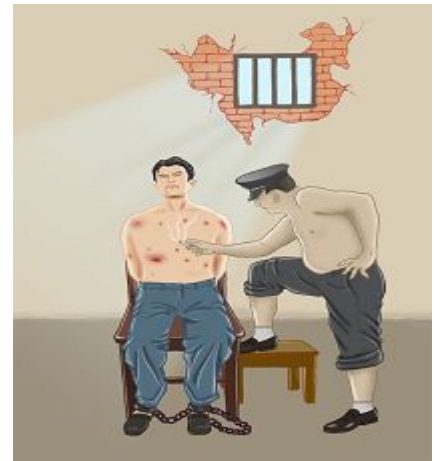
酷刑演示图：烟头烫

一位甘肃法轮功学员讲述：二零零四年五月十八日，被恶警绑架到乡派出所。恶警用烟头烫我的腿，我疼痛难忍，禁不住把头往地上撞。