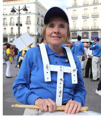
70 岁的鼓手 Strecker 女士