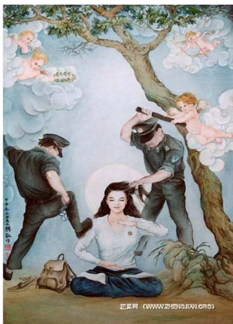
“真善忍”国际美展作品《金刚不动》

女子监狱长年进行服装来料加工，由山东济南华玫公司对外接揽服装订单给山东女子监狱，这些订单多数来自青岛。济南华玫不仅与山东女监有长期的服装加工来往，与其它省市的监狱也有长期的服装加工来往，长年加工的服装品牌有：H&M、ABC童装、杰克琼斯、寒思羽绒服、坦博尔羽绒服等。特别是H&M、ABC童装这两个服装品牌在女监每年成批大量加工至少有十年时间，个别订单一笔就有十万件。仅二零一二年通过服装加工山东女监就有3850万的收入进帐。◇