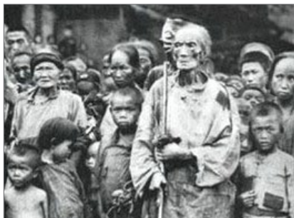
大饥荒中的中国百姓

深刻的是这样的照片：小孩坐在或站在稠密的稻子上面，稻子居然不倒。全国各地争放“卫星”，各地按虚报产量征购粮食，农民连种子粮也被迫上交。加上“大炼钢铁”，使庄稼无人收割烂在地里，导致 1959 年至 1961 年的大饥荒，当时中华大地饿殍遍野，大饥荒造成中国非正常死亡人口达 4000 多万。