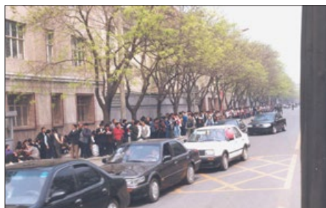
“4·25”和平上访现场。街道上车辆正常行驶，秩序井然。（在公交车中拍摄）

及非法抓捕40多名法轮功学员的天津事件，引发了“4·25”和平上访（国务院信访办就在中国南海附近）。法轮功学员和平上访，维护的是按“真善忍”做好人的权利，与中共所说的“搞政治”风马牛不相及。◇