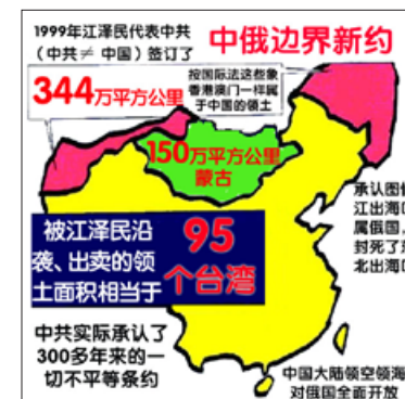
中共出卖的部分中国领土

1999年12月，中共党魁江泽民和俄罗斯总统叶利钦在北京签订《国界叙述议定书》，出卖了外兴安岭以南、黑龙江以北60多万平方公里的“外兴地区”，乌苏里江以东40万平方公里的“乌东地区”，17万平方公里的唐努乌梁海地区……承认了历史上的一切不平等条约，沿袭并代表中共出卖了344万平方公里的土地（按照国际法，这些国土可以如香港、澳门一样回归中国）。◇