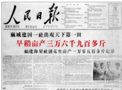
《人民日报》报道“亩产万斤”