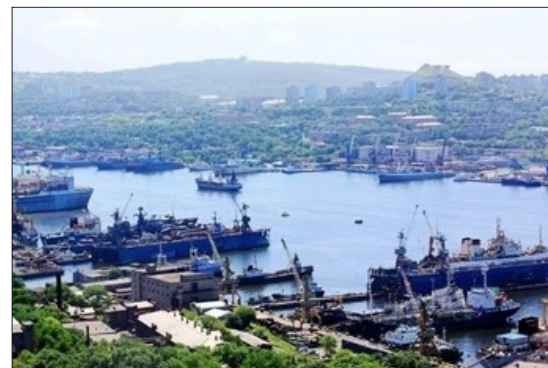
天然不冻港海参崴，原是中国固有领土。

中共建政后，为了政权的稳定，曾多次割让国土给周边小国，如巴基斯坦、缅甸、尼泊尔、朝鲜、越南、印度等。