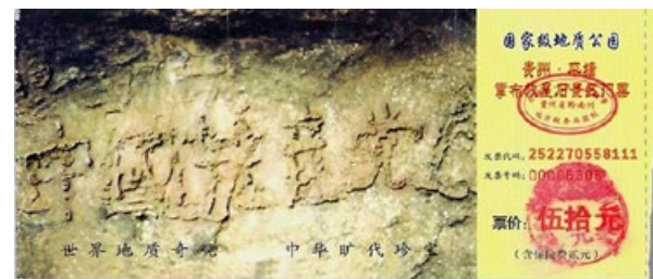
贵州省平塘县掌布乡藏字石风景区门票

贵州省平塘县掌布乡发现了一块距今 2.7 亿年的“藏字石”，500 年前崩裂的巨石断面上露出天然形成的 6 个大字：中國共產党亡。昭示着“天灭中共”的天意。◇