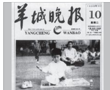
羊城晚报：老少皆练法轮功

■ 弘传世界： 法轮大法已经弘传到100多个国家和地区，受到世界人民的爱戴和尊敬。李洪志先生和法轮大法因对人类身心健康做出的杰出贡献，获各国政府褒奖、支持议案和信函3000多项。法轮功书籍被译成40种语言，在全球出版发行，并可在互联网上免费下载。◇