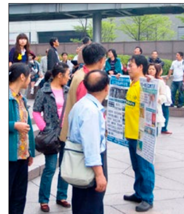
法轮功学员在海外旅游景点向中国大陆游客讲真相。

这是在欧洲某景点上的一段对话。法轮功学员讲真相，是在唤醒良知，救度一方。在灾祸肆虐的今天，当人们在危难中遇难呈祥时，才如梦初醒，才明白法轮功学员用自己的时间和收入，告诉人们真相，是慈悲之心使然，是为了世人有个平安、美好的未来。◇