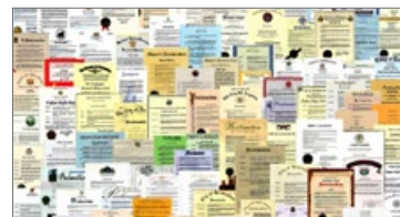
来自国际社会的褒奖（部分）