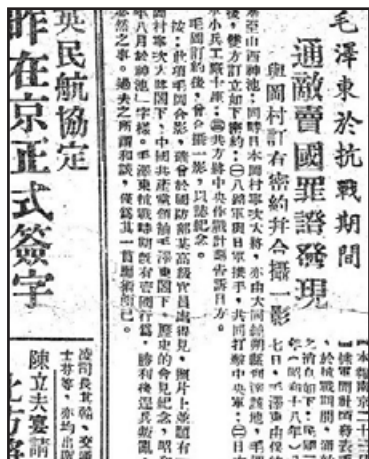
《时事公报》的报道（1947年）

在世界纪念抗战胜利69周年（1945年-2014年）之际，时事杂志《外交家》于2014年9月4日发表题为“抗日的不是中共，而是国民党”的文章，文中说：“中共在日本侵华的时候是可以选择的，