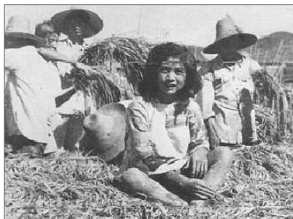
中共媒体为“亩产万斤”造势：稠密的稻子上面坐小孩，稻子不倒。

与此同时，粮食“亩产万斤”的假新闻充斥中共媒体。在一篇篇离谱的“新闻”中，让人印象