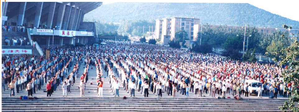
◆ 济南近万名法轮大法修炼者在山东省体育中心广场集体炼功（1998.10.1）这种炼功场景，在中共 99 年 7 月 20 日迫害法轮功之前，无论是在中国大陆的大中小城市或者是在城镇乡村都处处可见。

中共最害怕法轮功学员用传单、影碟、电视插播等方法讲真相，是不是最怕谎言和暴行被揭穿？其实中共与江泽民集团迫害法轮功就是建立在谎言与暴政基础上的。