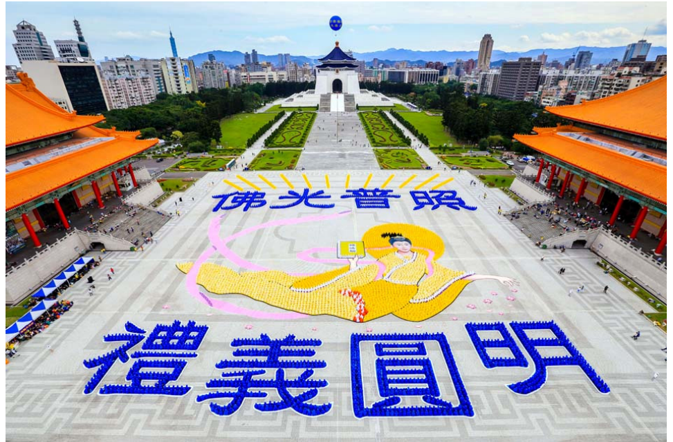
近 6000 名法轮功学员排组出“佛光普照 礼义圆明”8 个大字和美好画面。

活动负责人黄春梅女士表示，自由广场是台北市的著名地标，在此办活动意义非凡。这里每天有一车车的大陆游客来观光，这样的活动能让有缘人了解真相，受益其中。