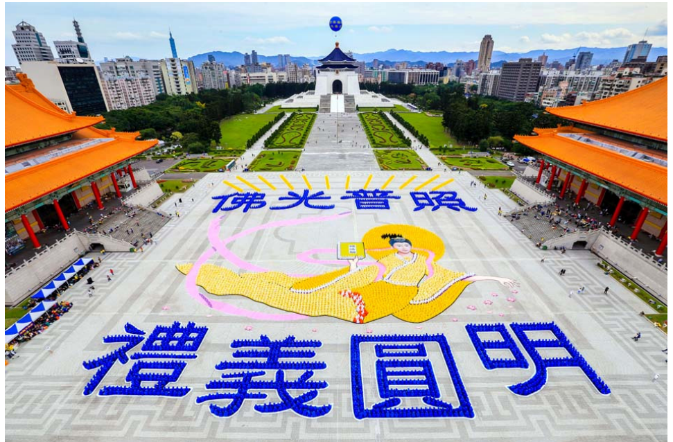
近 6000 名法轮功学员排组出“佛光普照 礼义圆明”8 个大字和美好画面。

活动负责人黄春梅女士表示，自由广场是台北市的著名地标，在此办活动意义非凡。这里每天有一车车的大陆游客来观光，这样的活动能让有缘人了解真相，受益其中。