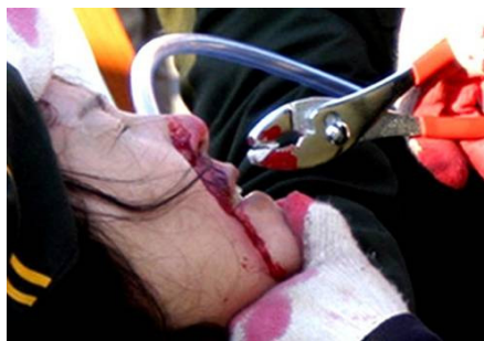
酷刑演示：用钳子撬嘴野蛮灌食迫害

公主岭对不出工的人冠以“抗拒改造”的罪名进行迫害，我被非法关押禁闭一个月。我以绝食抵制迫害，监狱狱警与帮凶犯人对进行野蛮灌食，拿特制的钳子把嘴撑开，将一根小手指粗的胶皮管插入喉咙，每次拔插胶管都带出血丝，当时那种感觉难以言表，泪水从双目夺眶而出。为了逼迫我就范，他们采取更为阴损的招法，狱警让包夹犯人背地里用一袋半（每袋子八两）精盐放入流食中，造成奇渴难耐，腹中灼热。当我向他们要水喝时，管小号的一个姓倪的狱警对我进行谩骂，拒绝给水。当时包夹我的二名犯人也受牵连，每顿一个凉馒头、几根咸菜条，其目的是让犯