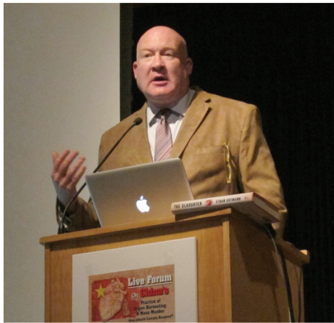
미국 전 싱크탱크 연구원인 중국문제 전문가 이산 구트만이 연설하고 있다.

이산 구트만은 그가 7년 동안 수백 번의 취재와 많은 문헌을 연구한 후 집필한 새 저서 ‘대도살(The Slaughter)’의 주요 내용을 소개했다. 그는 지금 논의의 초점은 중공이 양심수들의 장기를 생체적출했느냐 하는 것이 아니라 주요하게는 파룬궁 수련생의 장기를 생체 적출했느냐 하는 문제와 이 도살의 ‘규모가 얼마나 크며’ ‘지금도 계속 진행되고 있느냐’ 하는 문제라