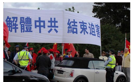
警察制止不明真相的学生製造事端

的车队快要接近酒店, 一位警察站到了隔离栅栏之后的法轮功学员和留学生之间, 保护学员。车队经过时, 留学生故意挤撞学员, 并拉扯横幅, 被警察制止。当三个学生分别伸出血旗试图遮挡法轮功横幅, 被警察将旗子直接拽出, 扔到草地上。◇