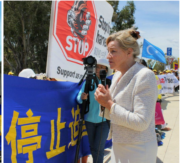
■ 二零一四年十一月十七日，法轮功学员在澳洲国会山庄集会。 ■ 国会众议员阿拉娜·麦克蒂尔南在集会上发言