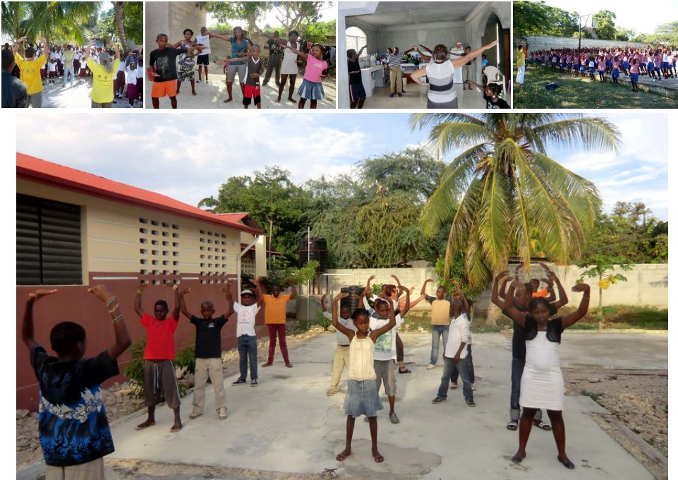
■ 二零一四年，为贫困街区开放的公共学校，学校学生学炼法轮功。

【明慧网】小时候，听爷爷讲过一个发誓应验的事：爷爷年轻时常和村里的人推着独轮车外出做买卖，一次他们住在一家客店，为了节省钱，大家就平均摊钱起火做饭。