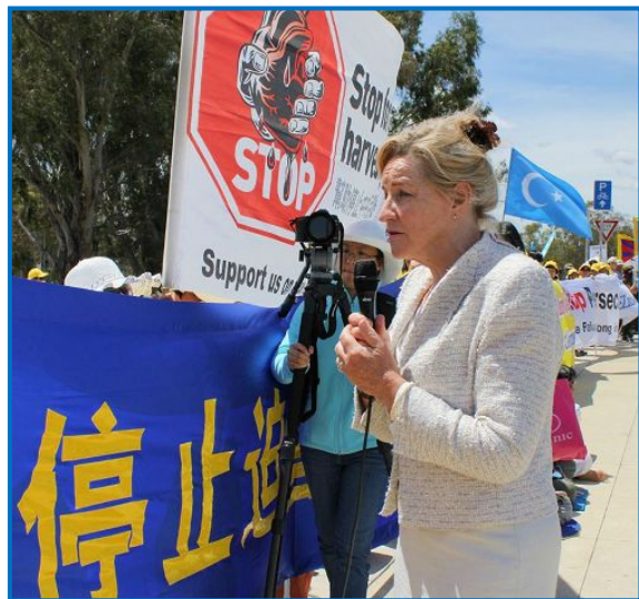
国会众议员阿拉娜·麦克蒂尔南在集会现场发言

来和谐与幸福,法轮功学员只希望中国社会最好。的确是这样,你们修炼法轮功,对中国将起到积极正面的作用,我们在澳洲已经见证了这一点。在澳洲我们知道,拥抱多元化使我们的国家更加强大。同时她也呼吁停止迫害法轮功、停止活摘器官。