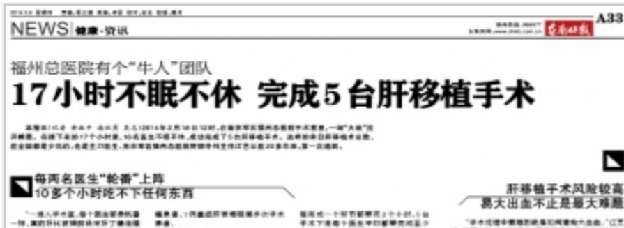
图：二零一四年三月六日，《东南快报》报导，南京军区福州总医院的“牛人”团队创造了十七小时内完成五台肝移植的“奇迹”。