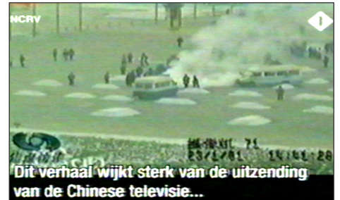
图:荷兰国家电视一台 2005 年 3 月 14 日《时事评论》节目揭露“天安门自焚”伪案,质疑突发事件中两辆警车为何备有(据中共报导)20 多个灭火器。国际教育发展组织 2001 年 8 月 14 日在联合国会议上声明:整个自焚事件是政府导演的。中国代表团面对确凿证据,没有辩辞。

第二天一大早,女孩把我拉到没人的地方,硬要给我 100 元钱,让我转交给做资料的人。她说:你们大法弟子太伟大了,身处魔难,却省吃俭用地攒钱做资料救人,不图回报,我居然把台历撕了,太对不起你们法轮