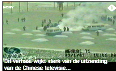
图:荷兰国家电视一台 2005 年 3 月 14 日《时事评论》节目揭露“天安门自焚”伪案,质疑突发事件中两辆警车为何备有(据中共报导)20 多个灭火器。国际教育发展组织 2001 年 8 月 14 日在联合国会议上声明:整个自焚事件是政府导演的。中国代表团面对确凿证据,没有辩辞。

第二天一大早,女孩把我拉到没人的地方,硬要给我 100 元钱,让我转交给做资料的人。她说:你们大法弟子太伟大了,身处魔难,却省吃俭用地攒钱做资料救人,不图回报,我居然把台历撕了,太对不起你们法轮