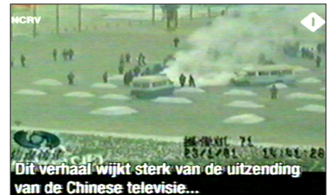
图:荷兰国家电视一台 2005 年 3 月 14 日《时事评论》节目揭露“天安门自焚”伪案,质疑突发事件中两辆警车为何备有(据中共报导)20 多个灭火器。国际教育发展组织 2001 年 8 月 14 日在联合国会议上声明:整个自焚事件是政府导演的。中国代表团面对确凿证据,没有辩辞。

第二天一大早,女孩把我拉到没人的地方,硬要给我 100 元钱,让我转交给做资料的人。她说:你们大法弟子太伟大了,身处魔难,却省吃俭用地攒钱做资料救人,不图回报,我居然把台历撕了,太对不起你们法轮