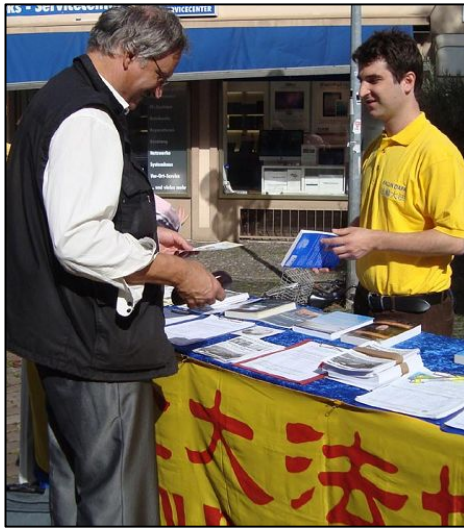
蒙丁传播法轮功真相

通过修炼他感到身体很好，通过专注地阅读法轮功书籍，他感到内心的平静，身体充满了能量。“哪怕我