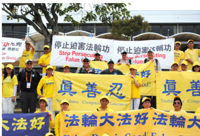
游行结束时，数名警察主动和学员们大合照

◎2014年11月，澳洲20国集团峰会（G20）期间，澳洲法轮功学员们以理性、平和的方式呼吁停止发生在中国的迫害，深深感动了澳洲警察，他们全程保护学员，并帮助排除中共使馆的干扰。活