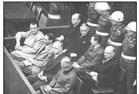
图:纽伦堡审判图片。1945年二战结束后,纽伦堡国际军事法庭否决了迫害帮凶们“奉命行事”的辩解。

最后的证据,就是“一线人员”错误运用法律,侵犯了法轮功学员的合法权利。然后其党再叫嚣,这些一线执法人员损害了“党”和国家的形象、给“建设事业”造成了巨大损失,云云。那些参与迫害法轮功的人员可能没