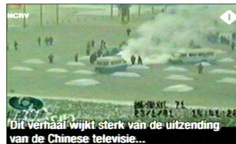
图:荷兰国家电视一台 2005 年 3 月 14 日《时事评论》节目揭露“天安门自焚”伪案,质疑突发事件中两辆警车为何备有(据中共报导)20 多个灭火器。国际教育发展组织 2001 年 8 月 14 日在联合国会议上声明:整个自焚事件是政府导演的。中国代表团面对确凿证据,没有辩辞。

第二天一大早,女孩把我拉到没人的地方,硬要给我 100 元钱,让我转交给做资料的人。她说:你们大法弟子太伟大了,身处魔难,却省吃俭用地攒钱做资料救人,不图回报,我居然把台历撕了,太对不起你们法轮