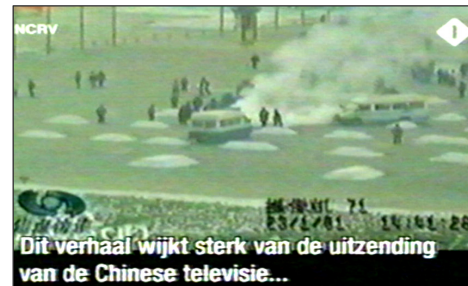
图:荷兰国家电视一台 2005 年 3 月 14 日《时事评论》节目揭露“天安门自焚”伪案,质疑突发事件中两辆警车为何备有(据中共报导)20 多个灭火器。国际教育发展组织 2001 年 8 月 14 日在联合国会议上声明:整个自焚事件是政府导演的。中国代表团面对确凿证据,没有辩辞。

第二天一大早,女孩把我拉到没人的地方,硬要给我 100 元钱,让我转交给做资料的人。她说:你们大法弟子太伟大了,身处魔难,却省吃俭用地攒钱做资料救人,不图回报,我居然把台历撕了,太对不起你们法轮