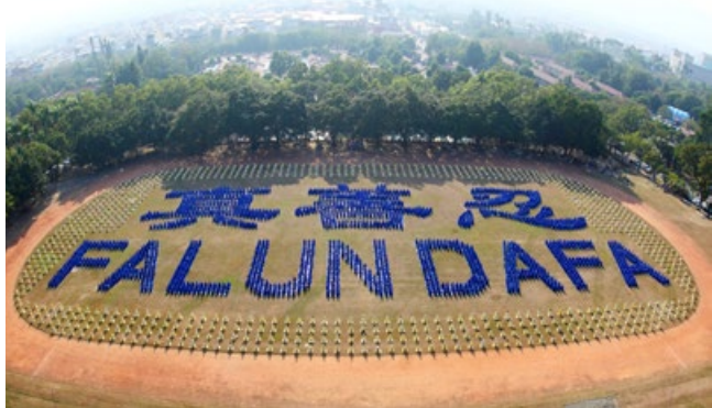
▲台湾法轮功学员排出“真善忍”三个大字和英文“法轮大法”