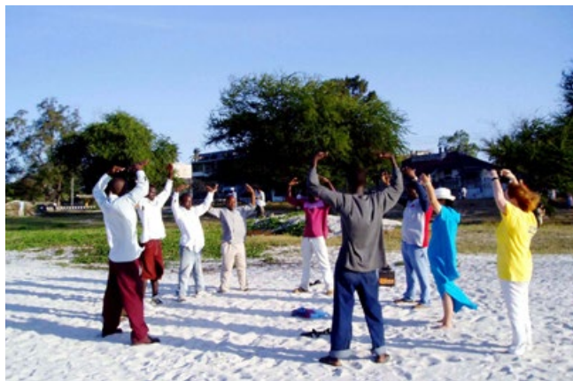
▲法轮功学员在坦桑尼亚最大的城市达累斯萨拉姆炼功