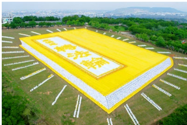
▲台湾6000多名法轮功学员在台中排出《转法轮》图形

李洪志先生的著作《转法轮》，1994年12月由中国广播电视出版社出版，1995年1月4日，《转法轮》首发式在北京公安大学礼堂举行，1997年成为中国10大畅销书，至今在世界众多国家畅销。2004年末，在澳大利亚由几万读者投选5000册最爱书籍排行，《转法轮》排列第14位，是此次投选中名列100名之内的唯一来自东方的书籍。20多年来，《转法轮》已经被译成40多种语言，吸引了世界100多个国家的上亿人修炼，被称为“是一本超越种族、民族、文化界限的奇书”。