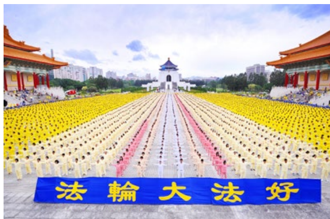
▲ 7000 多名法轮功学员在台湾自由广场炼功

在古老的佛国印度，各大城市都有法轮功炼功点。校园里更是修者众多，仅班加罗尔市的一些私立中、小学校、警官学校和某些学院学生就在集体学炼法轮功，并且受益良多。法轮大法主要著作《转法轮》中的《论语》被纳入学校英文教材的卷首。