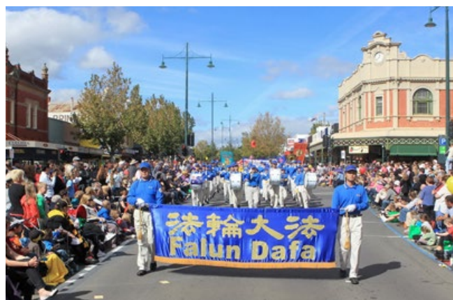
▲澳洲天国乐团受邀参加墨尔本盛大庆典活动