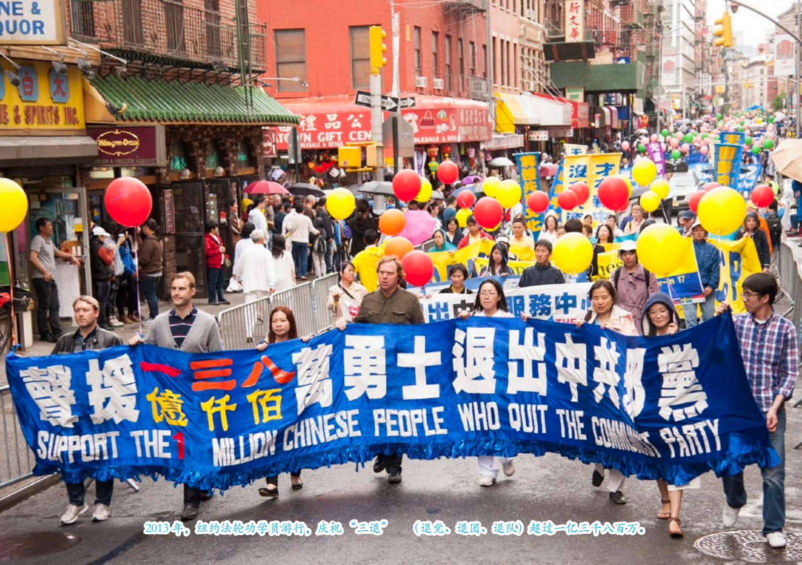
2013年，纽约法轮功学员游行，庆祝“三退”