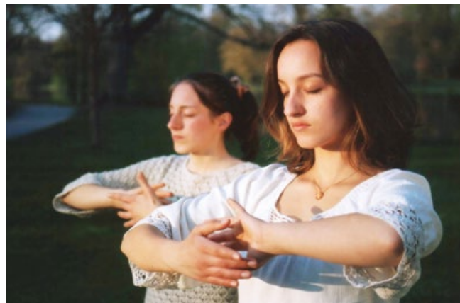
▲德国两姐妹在炼法轮功