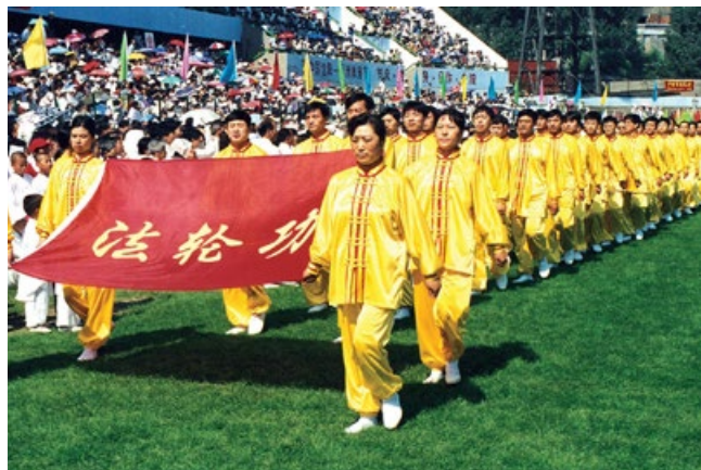
▲法轮功学员在1998年沈阳亚洲体育节上展风采

法轮功祛病健身的神奇功效和使人道德升华的感召力，在社会各阶层中有口皆碑。1999年7月，中共迫害法轮功之前，中国大陆几十家主要媒体（包括中央电视台、上海电视台、天津电台、各省报纸、杂志）在调查了解后，都对法轮功作了客观、正面的报道；公安部等对法轮功创始人李洪志先生和法轮大法予以褒奖；全国人大退休老干部的调查结论是“法轮功于国于民有百利而无一害”。