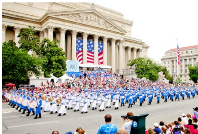
▲美国法轮功学员组成的“天国乐团”受到民众的欢迎