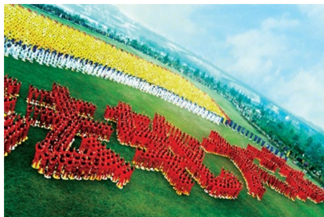
▲ 1999年3月，武汉法轮功学员排出“法轮大法”四个大字