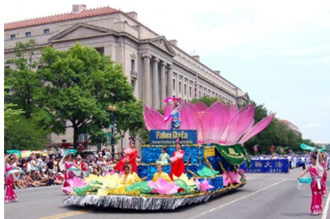
▲法轮功学员制作的精美花车受到沿途华盛顿民众的欢迎