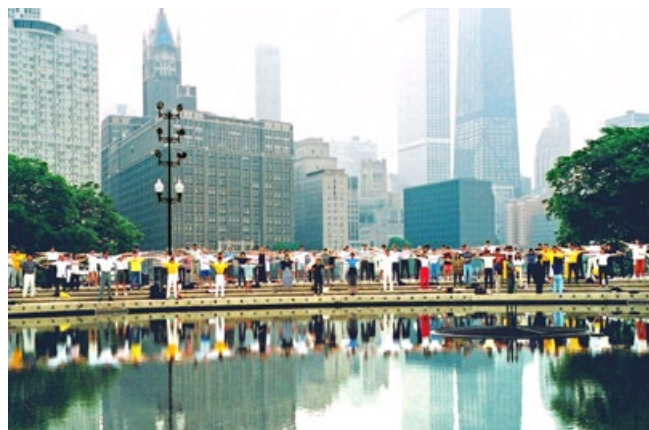
▲法轮功学员在美国芝加哥集体炼功