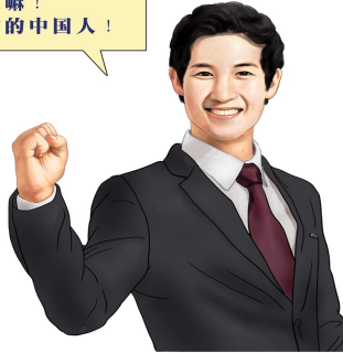
明慧网“三退是道德问题”征图作品

叫人“三退”(即“退党退团退队”)不是参与政治,而是在呼唤中华民族的道德。言而有信是讲道德,言而无信则是不讲道德。发誓都不当回事的人,您认为他讲道德吗?为人可信吗?