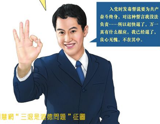
明慧网“三退是道德问题”征图