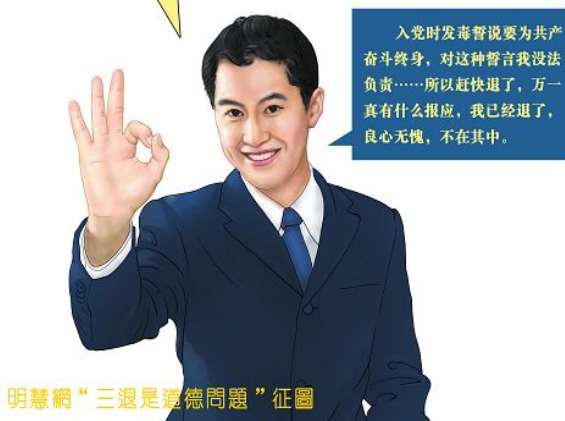
明慧网“三退是道德问题”征图