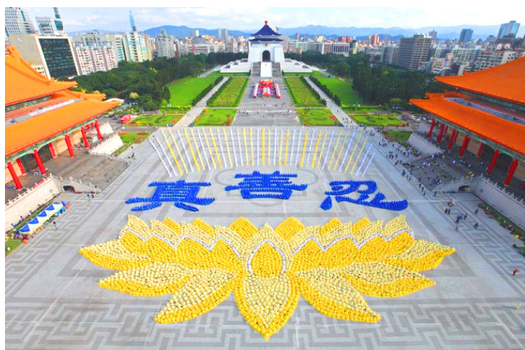
数千名台湾法轮功学员炼功排字：莲花映衬真善忍

载的仙界神花——优昙婆罗花在人间开放了，佛祖释迦牟尼在两千多年前讲到的婆罗花开，转轮圣王将在人间传法度人的预言来临。1992 年 5 月，法轮功创始人李洪志师父在中国长春市将被称为高德大法的法轮大法弘传于世。22 年过