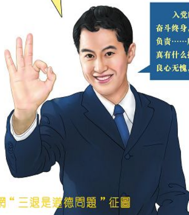
明慧网“三退是道德问题”征图